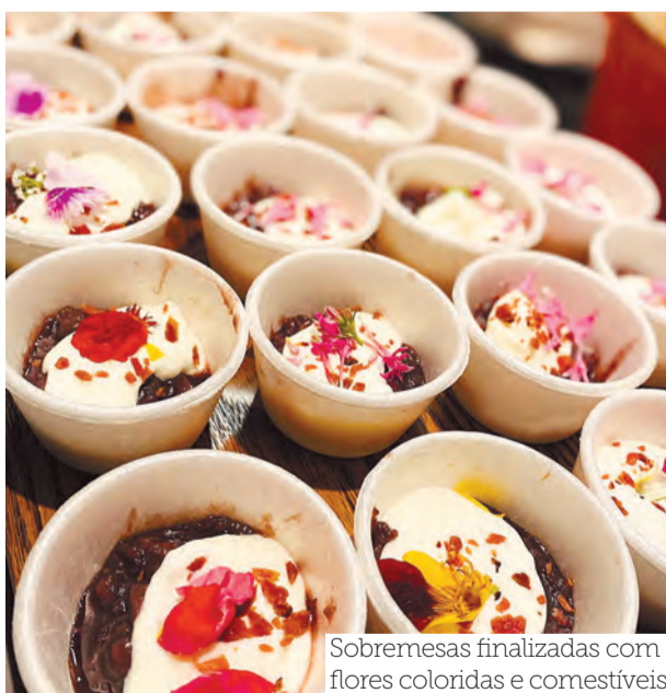
Sobremesas finalizadas com flores coloridas e comestíveis