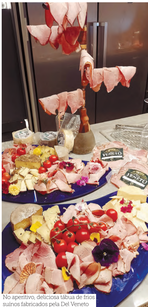
No aperitivo, deliciosa tábua de frios suínos fabricados pela Del Veneto