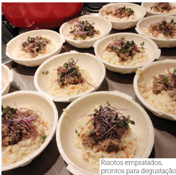
Risotos empratados, prontos para degustação